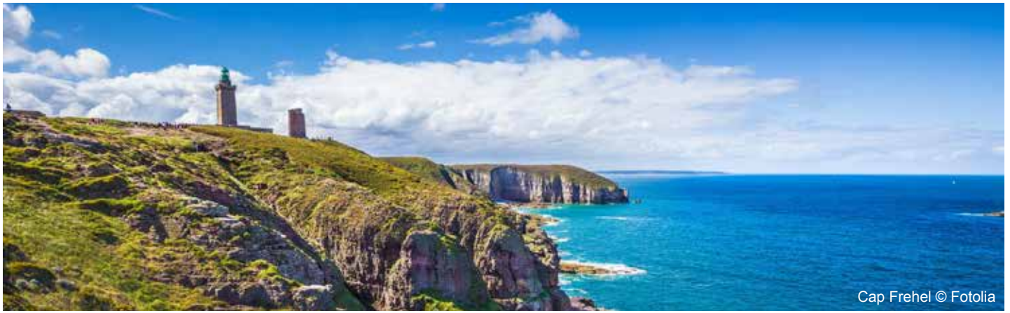
Cap Frehel