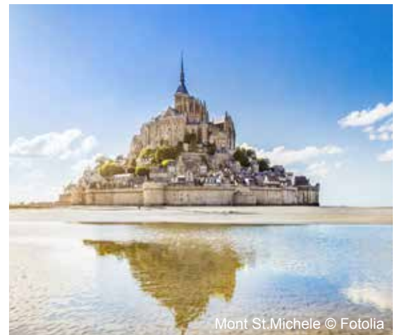
Mont St.Michele

Zunächst besuchen Sie Rennes, die Hauptstadt der Bretagne. Bei einer Stadtführung erleben Sie die mittelalterliche Alt- und Universitätsstadt. Nachmittags geht es weiter nach Fougères, die Vorzeigestadt der bretonischen Handelsplätze. Hier haben Sie die Möglichkeit, einen Spaziergang durch die Straßen von Vieil, dem ältesten Viertel der Stadt, zu machen, bevor Sie zurück nach Saint Malo fahren. Abendessen und Übernachtung im Hôtel France et Châteaubriand.