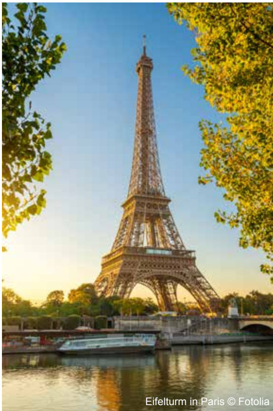
Eiffelturm in Paris