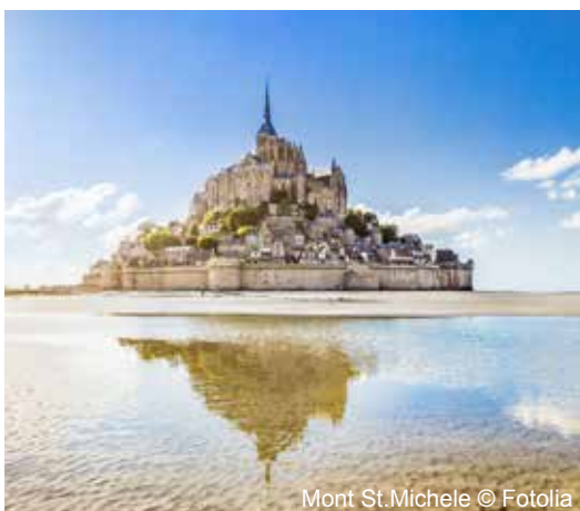
Mont St. Michele

ACHTUNG! Alle genannten Preise sind abhängig vom gewählten Reiseterrain!