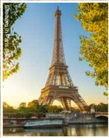
Eiffelturm in Paris