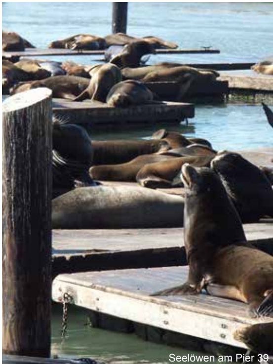
Seelöwen am Pier 39