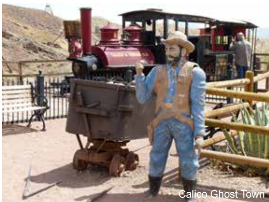
Calico Ghost Town