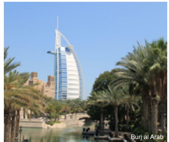
Burj al Arab

Morgens Transfer zum Bahnhof zur Zugfahrt mit dem „Coastal Pacific“ entlang des Pazifischen Ozeans nach Picton. Mit der „Interislander Fähre“ geht es durch den traumhaft schönen Queen Charlotte Sound und die „Cook Straight“ weiter nach Wellington. Abendessen & Übernachtung im „West Plaza Hotel“ o.ä..