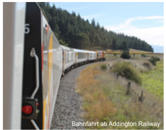
Bahnfahrt ab Addington Railway