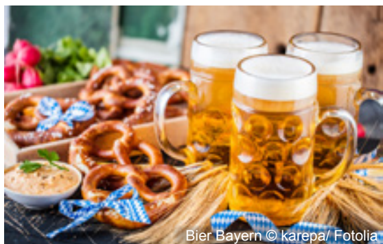
Bier Bayern

Für diese Reise steht nur eine begrenzte Anzahl an Einzelzimmern zur Verfügung! Mindestteilnehmerzahl: 30 Personen