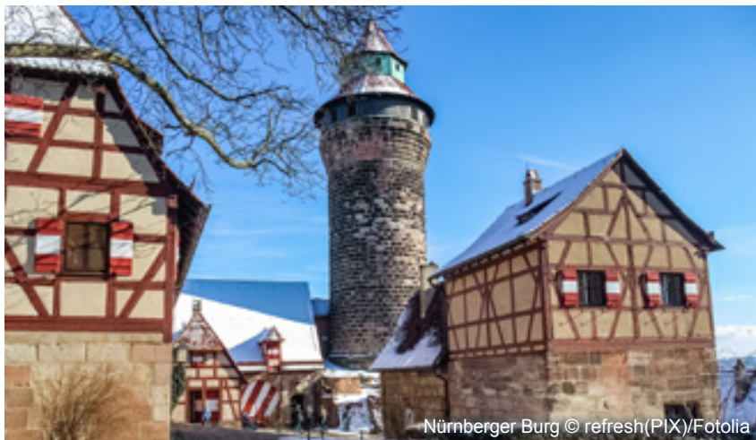
Nürnberger Burg