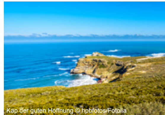
Kap der guten Hoffnung