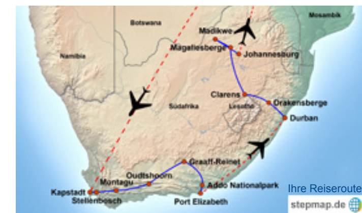
Ihre Reiseroute stepmap.de