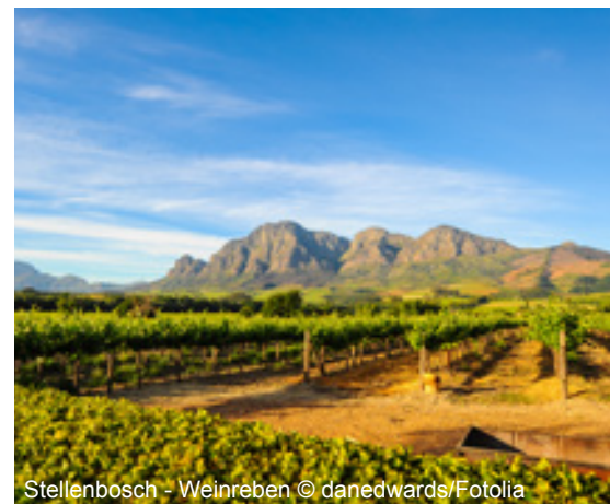
Stellenbosch - Weinreben