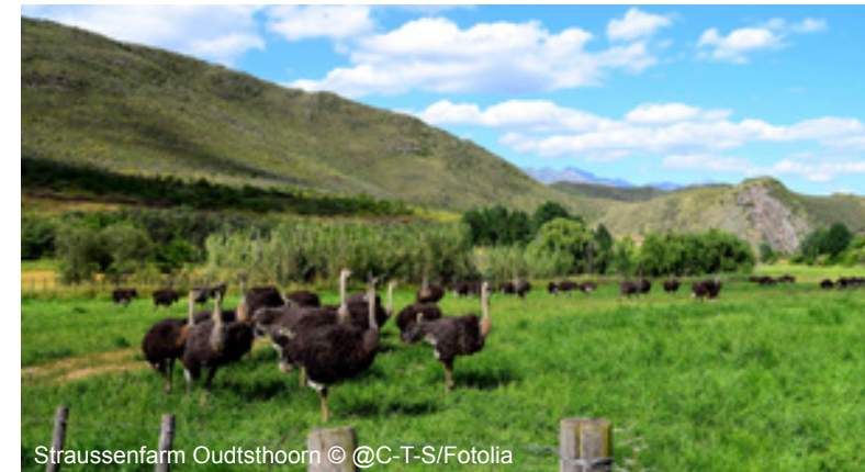
Straussenfarm Oudtshoorn