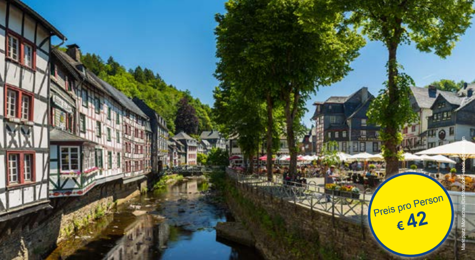
Marktplatz Monschau